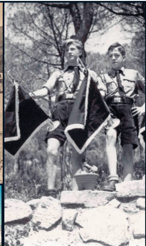
Dalt, a l'esquerra, la badia de Sant Pol tal com era als anys 30. Era la platja més propera per els hostes de la casa de vacances. Al centre, la ciutat de Sant Feliu de Guixols tal com era a principis del segle XX, i a sota, can Casas en l'actualitat. Damunt d'aquestes ratlles, joves hitlerians amb la fanfàrria que els caracteritzava.

no tan coneguda aquesta, d'Albert Spener a Castella. Com es pot veure, el moviment nazi al Principat i a Espanya no va ser pas escadusser.